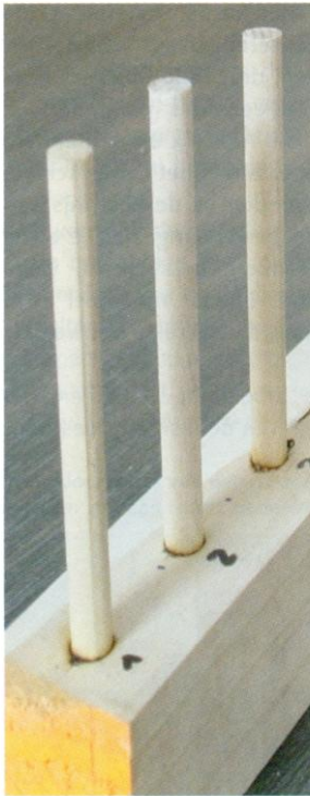
Figuur 2. Cirkelvormige wrijving

Figuur 2 geeft weer hoe de beukenhouten draibouten worden aangebracht in een massief onderstel waarin je vooraf gaten boort. Op de afbeelding zie je aan de basis van elke bout een donkerkleurige omzoming. Die wijst op de versmelting die plaatsvond als gevolg van de cirkelvormige wrijving.