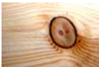
Kwast met schors